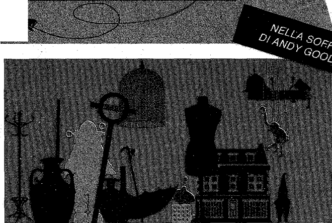
NELLA SOFFITTA DI MIA ZIA DI ANDY GOODMAN, CORRAINI